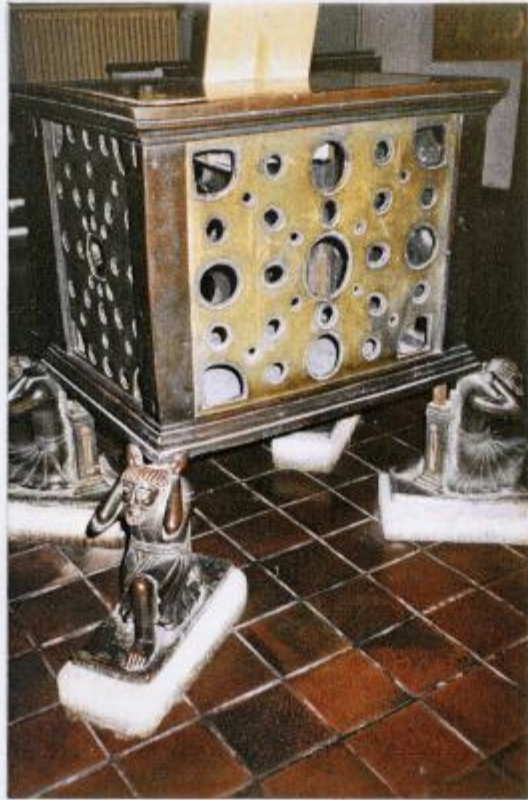
KROPO-ALTAR IN GOSLAR, GEFUNDEN IN BAD HARZBURG